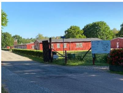
Foto 3. Indgangen til Frøslevlejren