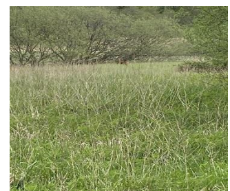
Foto 7. Rådyr i baggrunden

Kort inde på ruten passerer vi Padborg Friluftscene og spejdnernes hus. Scenen samler de lokale til koncerter, grundlovs møder, skovture og meget mere. Alt sammen med rod i grænselandet.