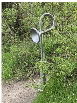
Foto 14. Jordtelefonen

Først i 1956 blev det lempet ved Rønsdam, så fx brandbiler kunne passere, hvis det var nødvendigt. Ved Schengenaftalen i marts 2001 blev det vedtaget, at overgangen skulle gøres fri til passage for cyklister og vandrefolk. Bommen findes stadigvæk og på samme sted findes en "jordtelefon" hvori man kan tale med hinanden på begge sider af grænsen. Det skulle vi naturligvis prøve og det virkede.