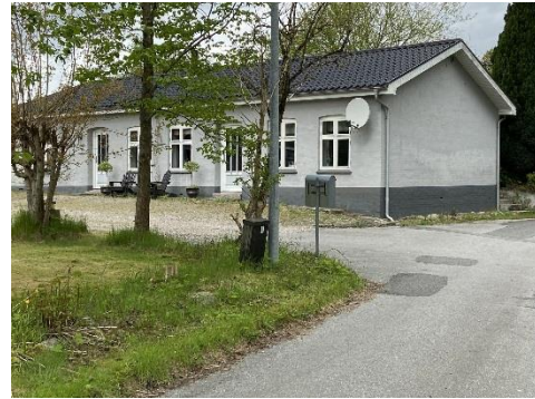
Foto 22. Barndomshjemmet i Smedeby