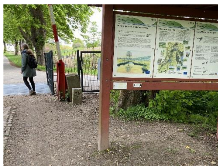
Foto 15. Den lille overgang ved Rønsdam