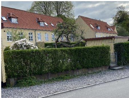
Foto 1. Den gamle toldgaard