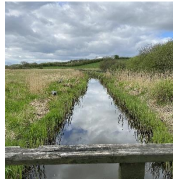
Foto 19. Over Krus-åen