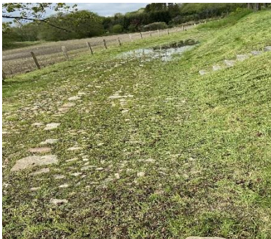
Foto 17. Den krumme Vej

Vejen er en af de ældste, stenbelagte veje i Danmark, og er sandsynligvis brolagt på Christian d. 4's tid, selvom den har været anvendt i mere end 400 år tidligere. I 1975 gravede Haderslev Museum på stedet og var med til at grave 42 meter af vejen fri. Stedet er ret enestående og har været et af de få, brede stykker vej i forhistorisk tid i området og her har således adskillige konger med følge redet forbi. Soldater er redet i krig, og handelsfolk har trukket okser til markederne. Der har været et liv her, på godt og ondt, som man næsten ikke kan forestille sig, men historien bliver levende på en vandretur.