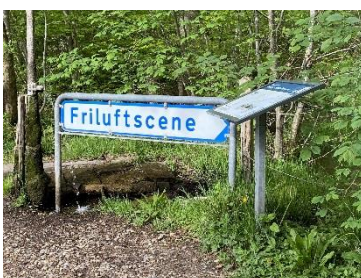
Foto 5. Friluftscene

Turen gennem Padborg skov ud til Nyhus sø følger i begyndelsen tæt på grænsen. Ældre huse ligger så tæt på, at man kan være i tvivl om forhaven er i Tyskland, selv når garagen er i Danmark. Det vidner om en tid, hvor grænsedragningen var noget andet.