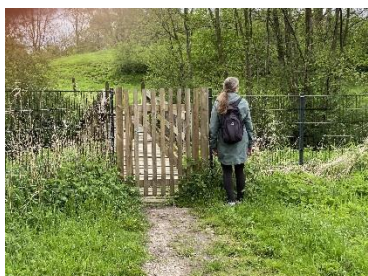
Foto 11. Vi går over Krus-åen

Når man har Nyhus sø på den højre side og er kommet gennem tunneldalen, skal man fortsætte videre ad gendarmstien mod venstre, men vi gik lidt på afveje mod højre, fordi man her kan passere over Krus-åen og komme til resterne af Nyhus borg på den tyske side. Borgen, som altså ikke eksisterer mere, blev bygget i 1345 og har sandsynligvis haft tilknytning til Flensborg og den livlige handel langs hærvejen. Den har ikke været stor, og måske har der også været gæstgiveri for handelsfolk, der var på vej mod Hedeby. Kort derfra på den danske side finder vi nemlig "den krumme vej". Vejen kaldes både Oksevejen og Hærvejen og den har krydset den lille vej ved Nyhus. Man kan kun forestille sig, hvordan pilgrimme, soldater, handelsfolk, studedrivere og mange andre har gået der forbi gennem flere århundreder. Vejen var ret central for det videre færd ned mod syd. Ved hver mindre grænseovergang markerer grænsestenene på hvilken side, du befinder dig.