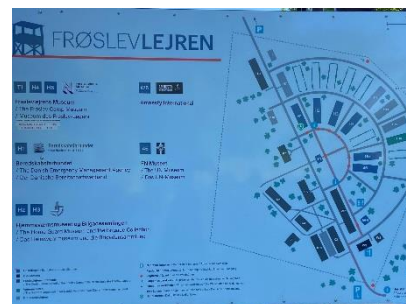
Foto 4. Informationstavle

Da tyskerne besatte Danmark d. 9. april i 1940 blev 3 grænsegendarmere skudt i Padborg, idet tyskerne troede, det var sabotører, der ville sprænge jernbanen i luften. I linket fra Grænseforeningen gives flere informationer om Grænsegendarmeriet.