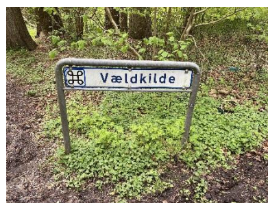
Foto 10. Der er mange kilder