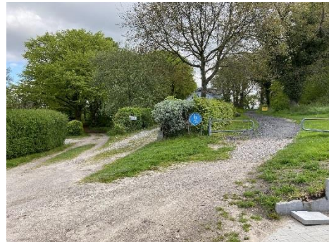
Foto 2. Gendarmstien til venstre og cykelruten til Harrislee til højre