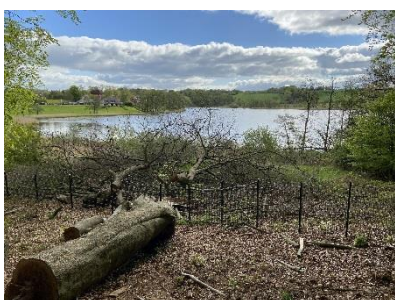
Foto 8. Nyhus Sø

Tunneldalen er dannet under sidste istid, hvorfor der er en del kildevæld, der springer frem. Siden 2002 har der været adskillige grænseoverskridende samarbejder på naturområdet for at bevare beplantning og fugleliv. Man kan både høre nattergal og se en munk, hvis man har øje og øre for det. Landskabsmæssigt er der masser af pile- og ellekrat. Og hvor der er insekter, er der også fugle. Så tag gerne en kikkert med.