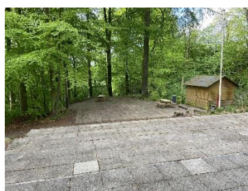
Foto 6. Kig til scenen