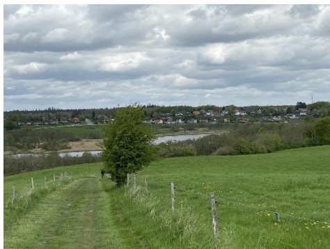
Foto 18. På vej mod Møllesøen