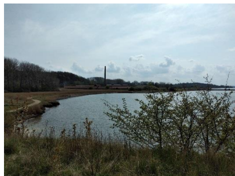
Foto 27. Udsigt til teglværket Cathrinesminde

Resten af etappen går vi langs Iller Strandvej til Brunsnæs. Ude på fjorden er der udsigt til Holnæs den sydslesvigske halvø på Angeln (1,4 km). Så tæt har/er vi forbundne og allerede i 1209 var der en lille færgeforbindelse mellem Brunsnæs og Holnæs og selvfølgelig har der været kroer og gæstgiverier på begge sider, der på en god sommerdag havde travlt. I 2019 etablerede Sønderborg kommune en ny "cykelfærge"-forbindelse, hvor det blev muligt at tage cyklen med på rundtur. Men langs strandvejen er der mange små skilte, der forklarer og fortæller om gamle dages aktiviteter. Når hvidtjørnen blomstrer og det gør den på vores tur, dufter der så dejligt, men en af de berømte hvidtjørne, Brunsnæstjørnen, siges at stamme fra Erik af Pommerens tid (ca. 1400). Den var sømærke, men blæste omkuld i stormen 1999.