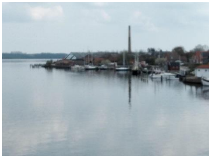
Foto 16. Et kig ind i noret fra broen

Vi går nu over broen denne gang, og kan på venstre side se ind i noret og man skal forestille sig, at der tidligere har været mange teglværker langs med vandet. (Der er endnu få tilbage) Og en livlig trafik af skibe. Dette miljø inspirerede malerne i høj grad. Naturalismen var den nye ide.