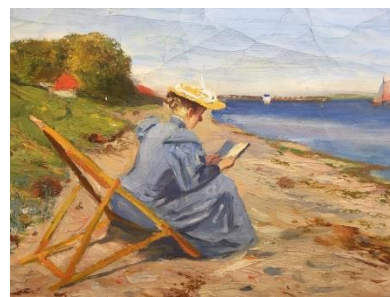
Foto 11. En kvinde på stranden