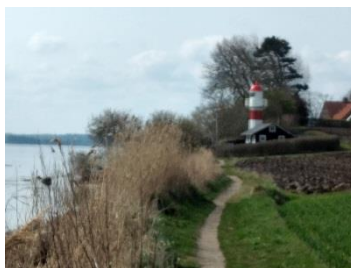
Foto 12. Fyrtårnet i Dalsager, Rinkenæs

Herfra kan vi se ud mod Alnor og op til Anton Nissen hus. Vi beslutter os til at gøre et lille ophold ved campingpladsen Lærkelund og spiser vores madpakker.