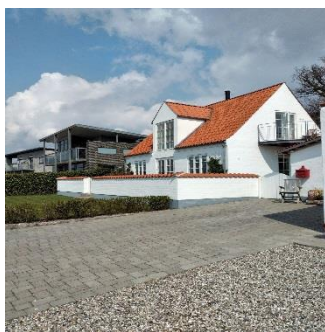
Foto 22. Ældre, renoveret hus på Lågemade