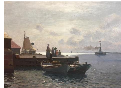
Foto 18. Maleri

Så kommer vi på den anden side på Broagerland og følger gendarmstien ind til højre ved det gamle færgeleje. Meget er sket siden da og meget er under forandring, men i 1870'erne, hvor mange malere lod sig indkvartere skal man forestille sig, at der var brug for overnatning. Schumanns Gasthof var et af stederne. Her samledes kunstnerne fra 1900, hvis ikke de boede privat. Ofte var det sådan, at fiskerne flyttede ud af deres huse og ind i deres skure og overlod huset til betalende gæster. Mere end 40 kunstnere regnes for i dag at have tilhørt kunstnermiljøet i Egersund. De fleste af kunstnerne havde en tilknytning til Slesvig-Holsten og var uddannet på tyske kunstakademier. Kroen eksisterer ikke mere og er revet ned. Men man kan se den i nedenstående link og i videoen fra Kunstmuseet Brundlund Slot, hvordan der har set ud dengang.