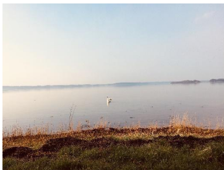
Foto 1. Udsigt til Okseøerne og Lyksborg

Foto 1 og Foto 2 er stemningsbilleder ud over fjorden. Her fra stranden ved Rønshoved ser vi Okseøerne og Sønderhav og billede 2. viser udsigten til den tyske kyst ved Lyksborg. Smukt! Den rene idyl!