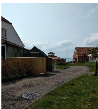
Foto 19. Her lå kroen i sin tid

Så kommer vi på den anden side på Broagerland og følger gendarmstien ind til højre ved det gamle færgeleje. Meget er sket siden da og meget er under forandring, men i 1870'erne, hvor mange malere lod sig indkvartere skal man forestille sig, at der var brug for overnatning. Schumanns Gasthof var et af stederne. Her samledes kunstnerne fra 1900, hvis ikke de boede privat. Ofte var det sådan, at fiskerne flyttede ud af deres huse og ind i deres skure og overlod huset til betalende gæster. Mere end 40 kunstnere regnes for i dag at have tilhørt kunstnermiljøet i Egersund. De fleste af kunstnerne havde en tilknytning til Slesvig-Holsten og var uddannet på tyske kunstakademier. Kroen eksisterer ikke mere og er revet ned. Men man kan se den i nedenstående link og i videoen fra Kunstmuseet Brundlund Slot, hvordan der har set ud dengang.