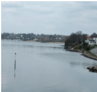
Foto 17. Det gamle færgeleje i Alnor