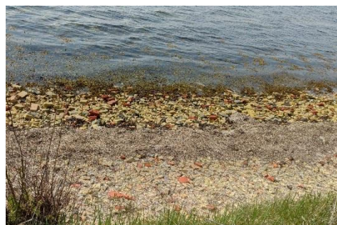
Foto 23. Tegl på stranden