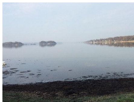
Foto 2. Udsigt til Okseøerne