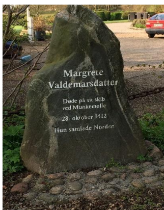
Foto 3. Mindesten ved Munkemølle