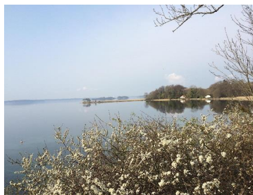
Foto 4. Langs stien fra Munkemølle til Sandager