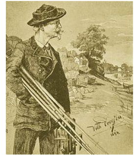
Foto 9. Selvportræt