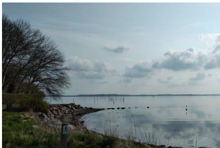
Foto 10. Fra Sandager mod Alnor

En kvinde sidder nede på stranden i en stol og læser i en bog. Det er en dejlig sommerdag. Kjolen er blå og stråhatten skygger for solen. Ude på fjorden har skibene travlt, og i horisonten dukker Egersund og teglværkerne op.