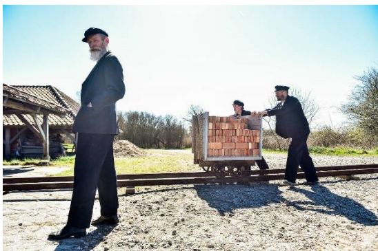
Foto 26. Statister på teglværket deltager i filmatiseringen af serien "Grænseland" 2020