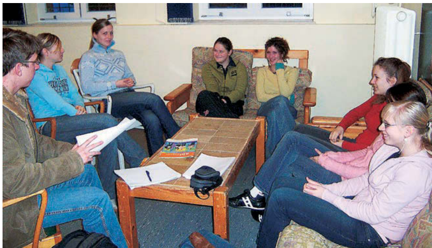
På det tyske gymnasium Auguste-Viktoria-Schule blev eleverne fra Duborg-Skolen vel modtaget, da de kom på besøg for at udspørge elever, som havde valgt dansk som fremmedsprog.