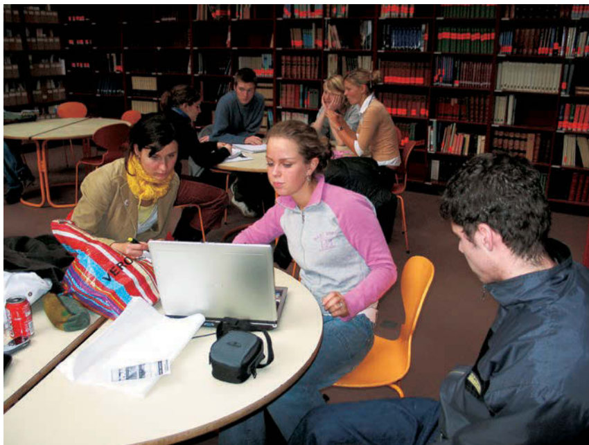
Research på internet og i grupper. Elever fra historieklassen på 12. årgang arbejder på at opklare historien om Bonn-København Erklæringerne.