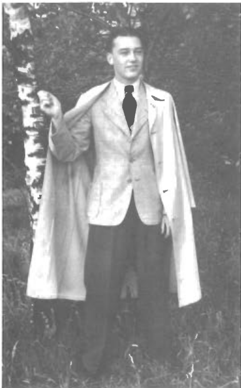
W. L. 1938.

foretrak at danse med marinesoldater. De fra hæren holdt mest til på »Bellevue«. Også »Colosseum« og »Wiener Caf « hjems gte vi. Navnlig »Colosseum« var et popul rt sted, fordi der her var variet opr den.