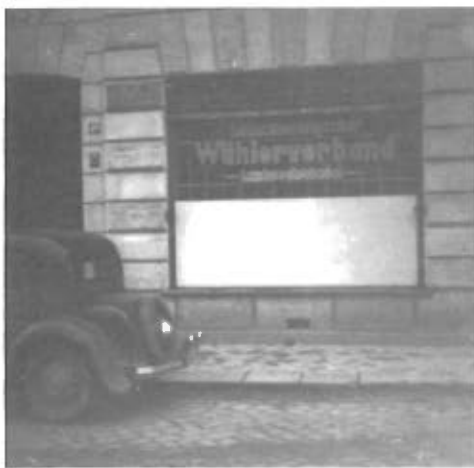
SSVs landssekretariat i Slesvig by.