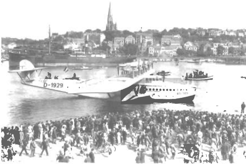
Do X i Flensborg 30. juli 1932.

gårdender. Ud for indgangen fra Søndergårdender flød Møllestrømmen forbi. Her havde også brandværnet til huse – med biler med massive gummidæk, og ved siden af lå »tyrestalden«, tidens detention, hvor de berusede blev indsat, når de var samlet op af »Grüne Minna« (Salatfadet), et grønmalet hestekøretøj.