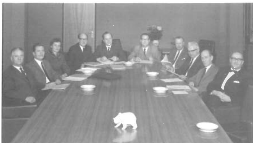
SSVs byrådsgruppe i Flensborg 1966-70.