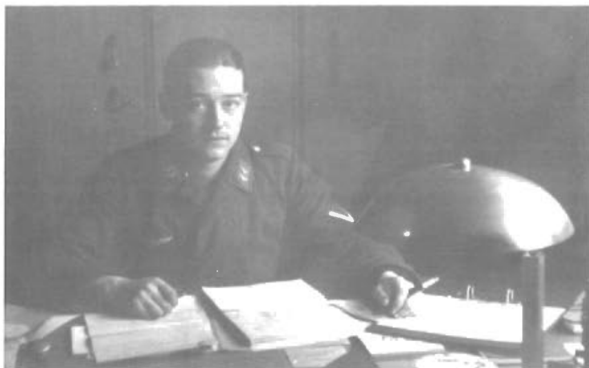
Skrivestue »gefreiter« i Holland 1941.

fraterniserede – og dem var der masser af – var jo så venlige. Det gik også først senere op for mig, hvad der egentlig skete med de mennesker, som jeg en dag så marchere under bevogtning til banegården, nemlig jøder på vej mod lejrene i Øst.