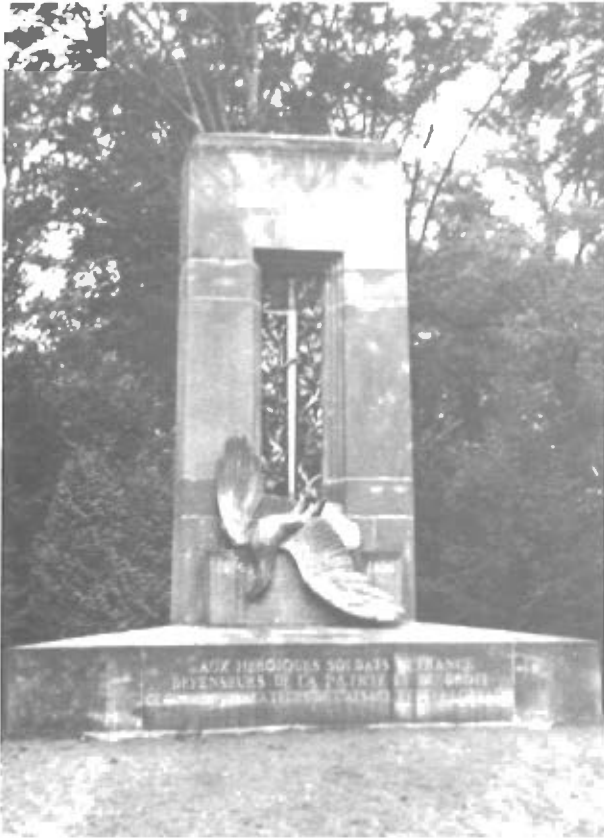
Det »berygtede« Mindesmærke.