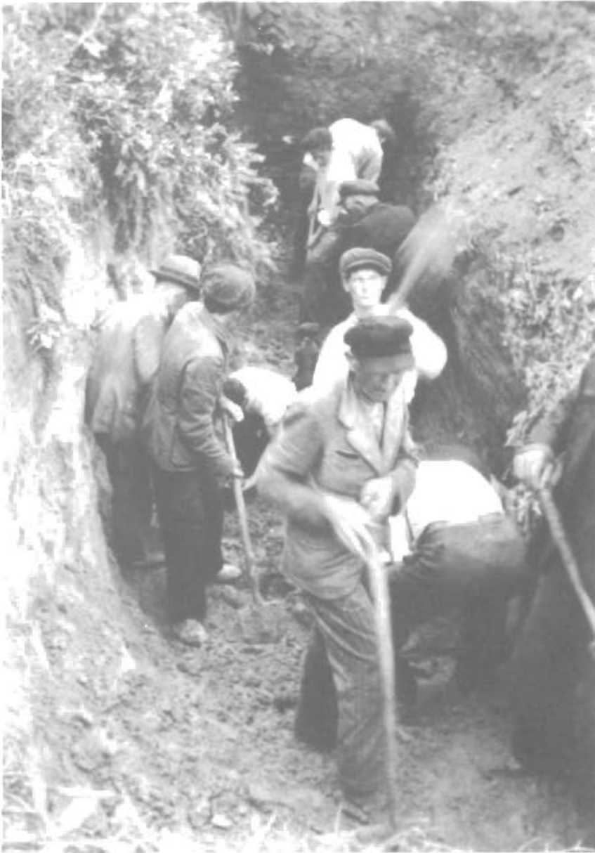
Ung og gammel graver deres egen Grav.