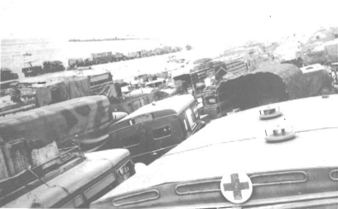
Engelske Biler i Tusindvis langs Stranden.