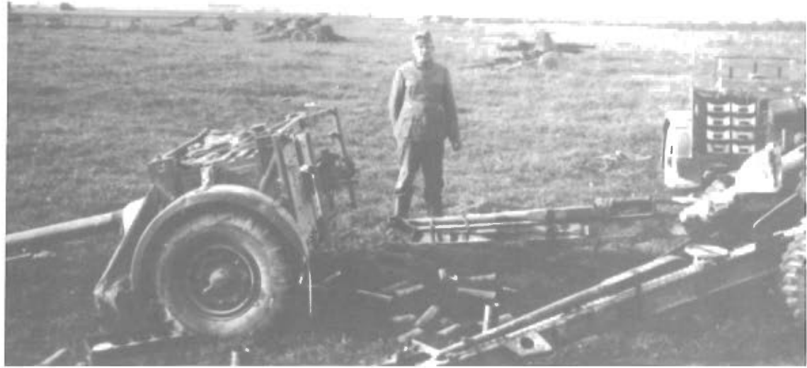
Efterladt Krigsmateriel langs Vejene.