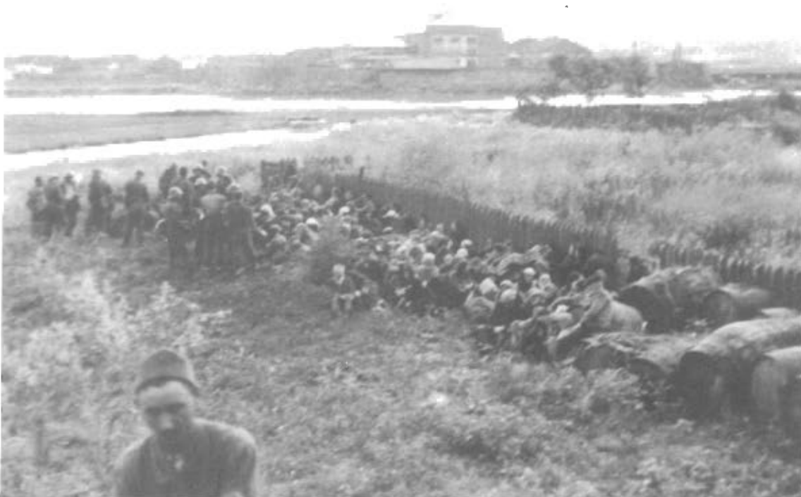
Mænd, Kvinder og Børn venter på Exekutionen.