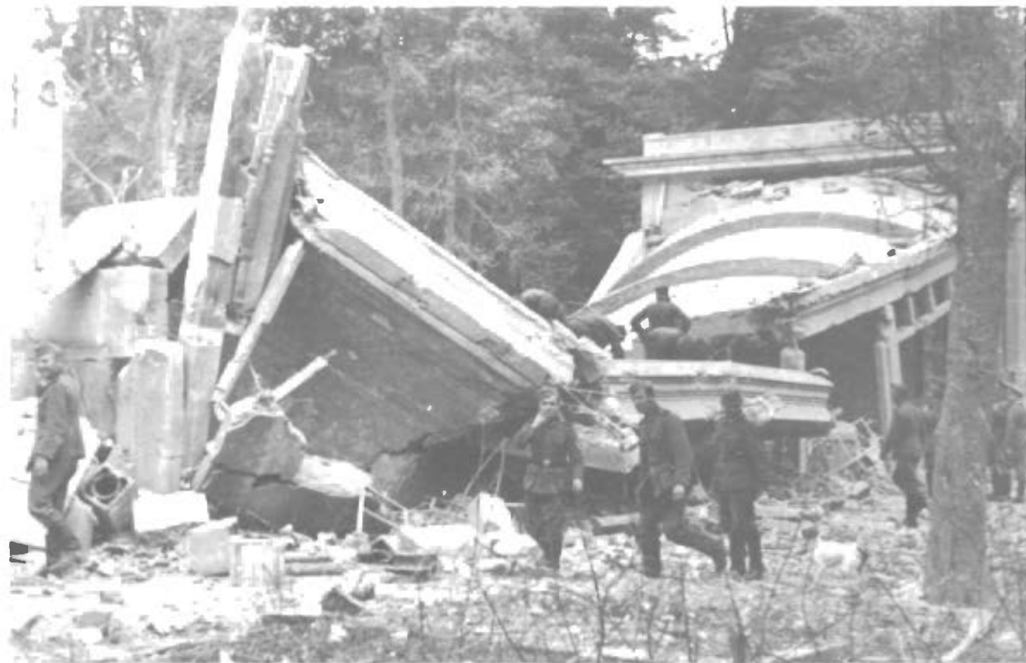
Den ødelæggende Virkning.