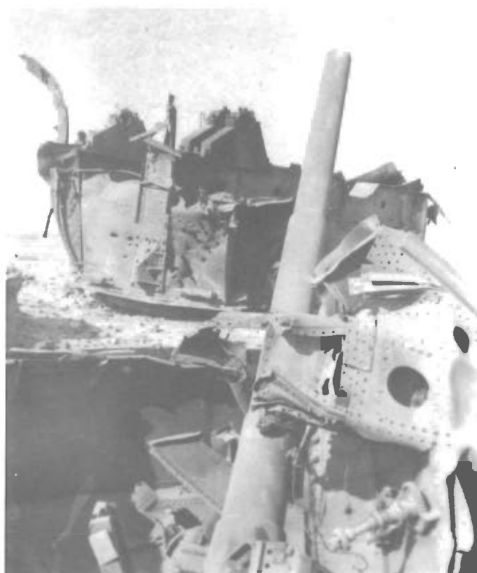
juli 1942 Fortet Maxim Gorki foran Sewastopol, det sønderskudte Pansertårn.