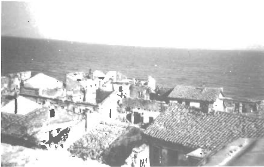
Det sønderskudte Kertsch, Ruslands »Dunkerque«.