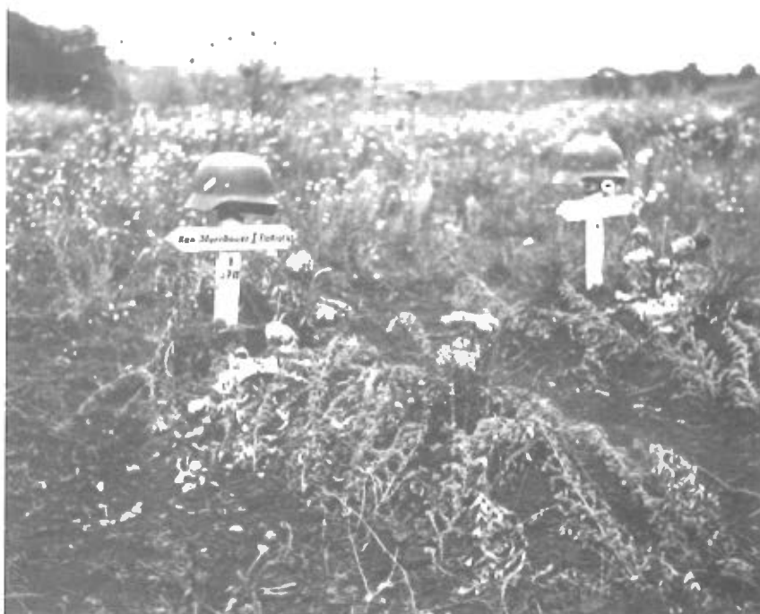
Tyske krigsgrave ved Glingeni.