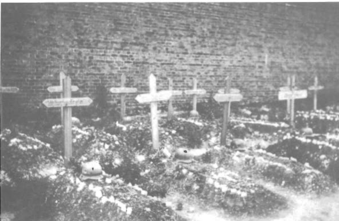
5.7.1940 Tyske Soldatergrave ved Amiens, Frankrig.