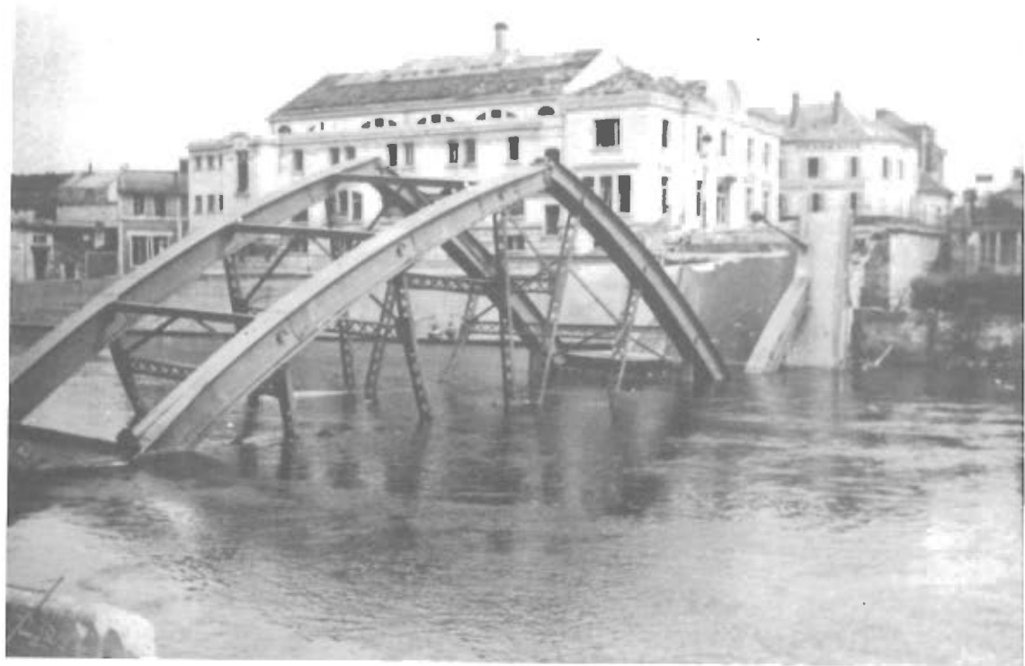
24.6.1940 Ødelagt Bro ved Creil, Frankrig.