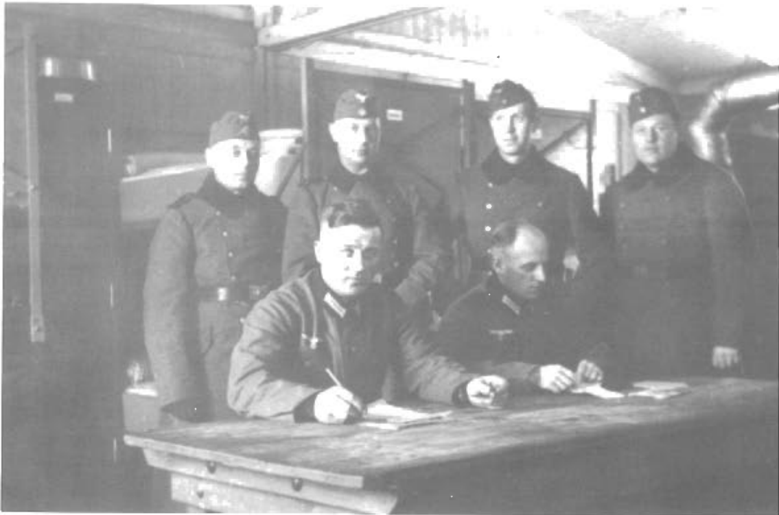
5.2.1940 I Skrivestuen i Münster – Lager.