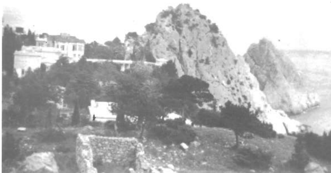
juni 1942 Ved Sorte Havets Klippekyt.