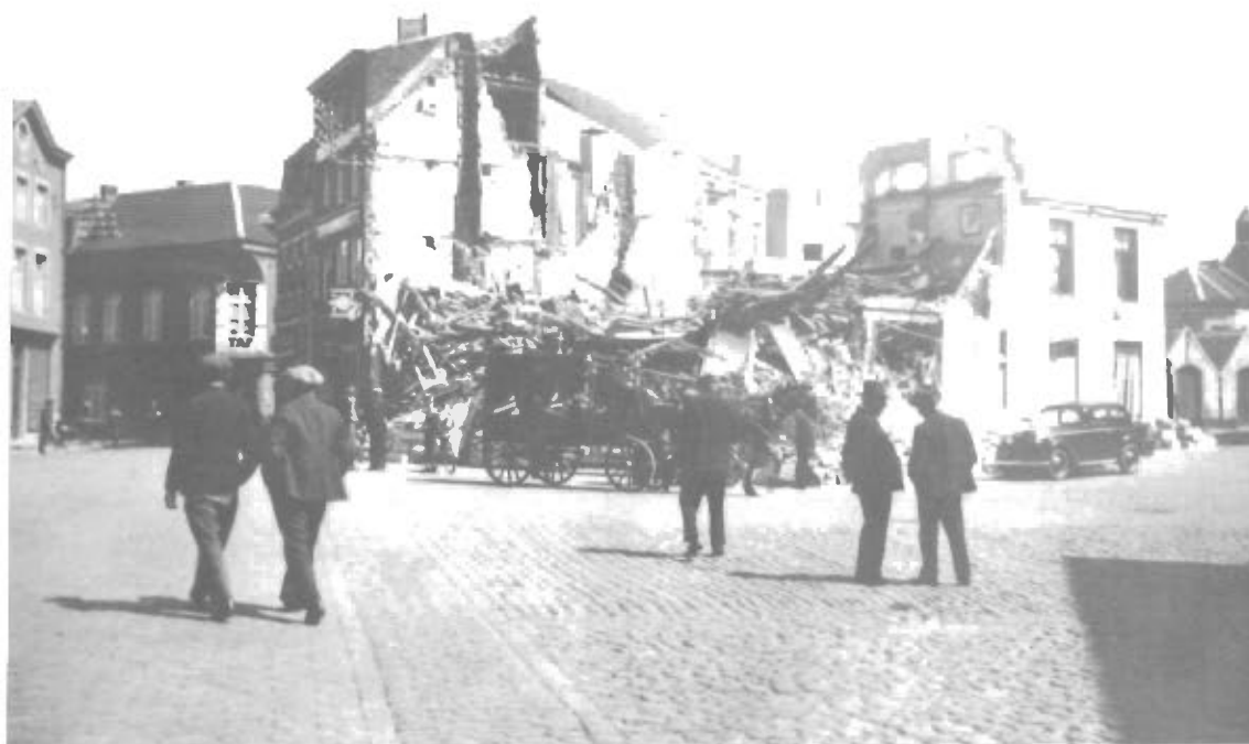
1.6.1940 Krigens Ødelæggelser. Byen Tongern, Belgien.