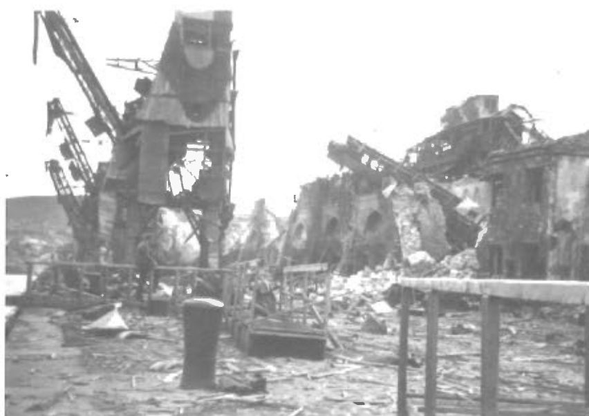
I Feodocia, den af Stukas ødelagte havn.