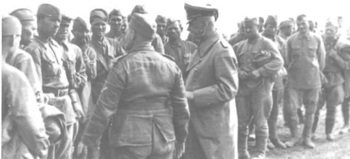
4.7.1941 De første russiske Fanger. General v. Salmuth i Samtale med dem.