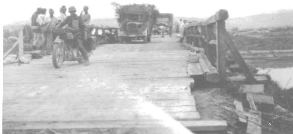
3.7.1941 Over Grænsefloden Pruth.