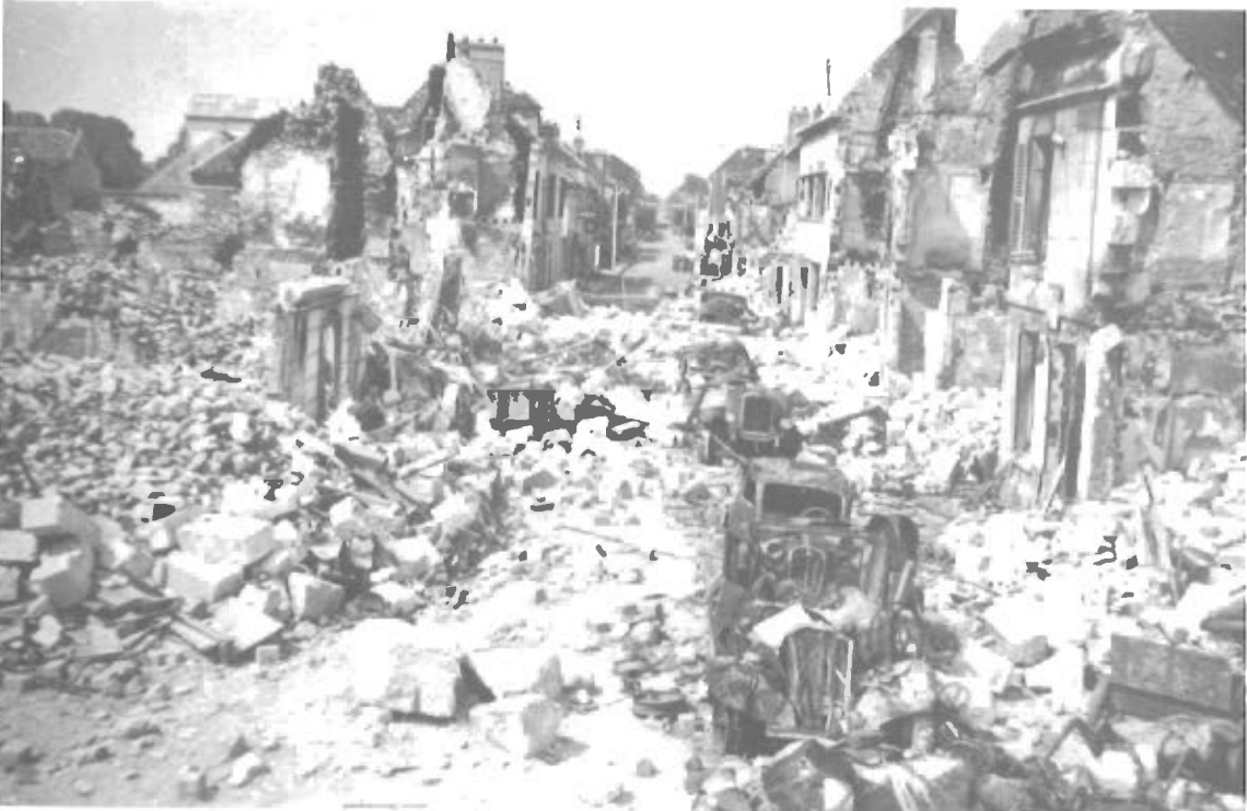
28.6.1940 En By i Ruiner – Pont St. Maxence – ødelagt bilto.