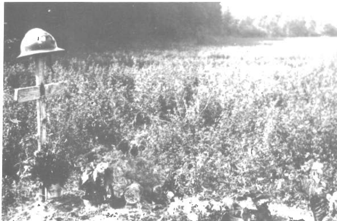
25.8.1940 En fransk Soldatergrav ved Monchy St. Eloi.