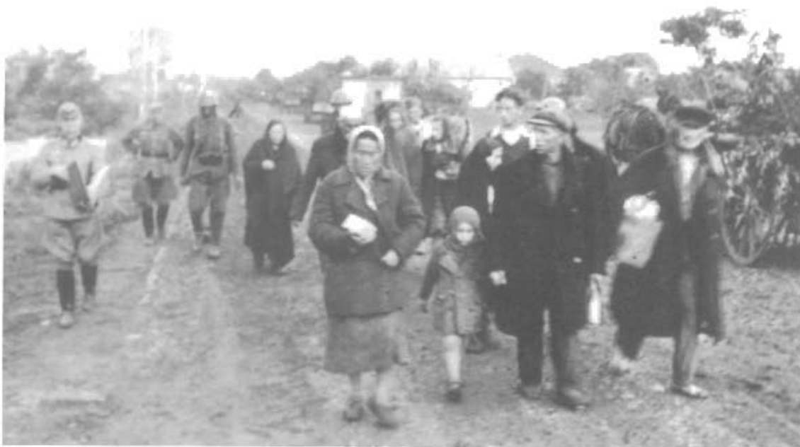
Rumænske Soldater driver Jøderne sammen.