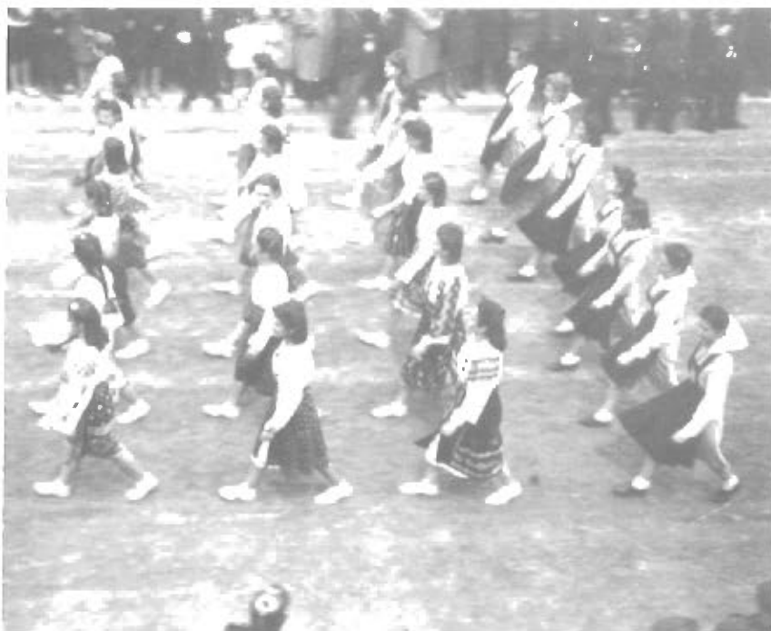
Optog fra en folkefest i Buzau, Rumænien maj 1941.

samtlige divisionens motorkøretøjer havde han visse forrettigheder, og han skriver i et brev, at han har et selvstændigt, let og interessant arbejde og ikke er med i forreste linie.